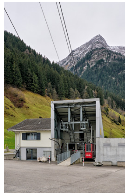
Die Talstation der Golzern-Seilbahn wurde nach dem grossen Unwetter von 2005 neu gebaut.

Einen kurzen Überblick über die Geschichte der Berghilfe finden Sie hier.