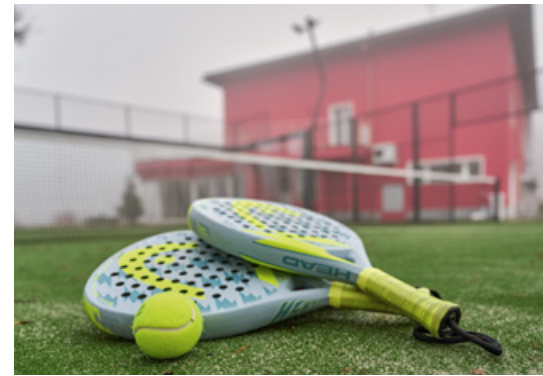
Speziell für die sportlichen Gäste: der Padel-Tennis-Court.