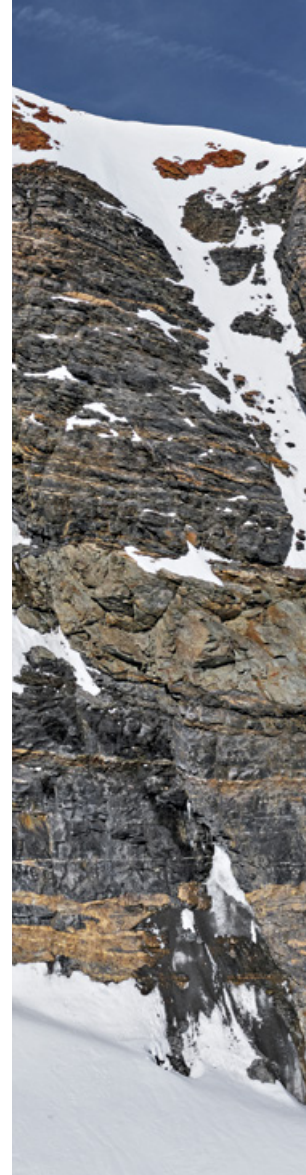
Die Mönchsjochhütte klebt über dem Gletscher am Fels des Mönchs.

Bei den Arbeiten an der Aussenwand der Hütte müssen die Arbeiter ständig gesichert sein.