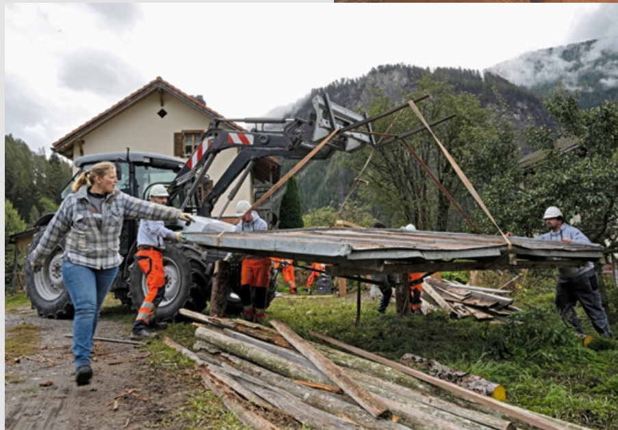
Um das alte Dach zu platzieren, braucht es jede Hand.