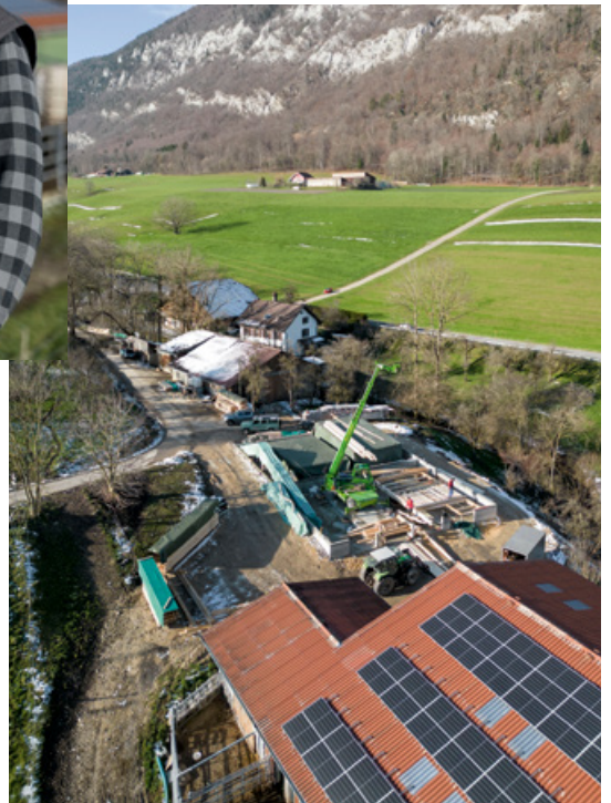
Auf der sich im Bau befindenden Scheune werden weitere Solarpanels montiert.